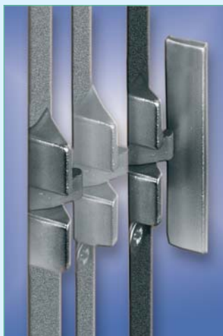
Фальцевая защелка MACO