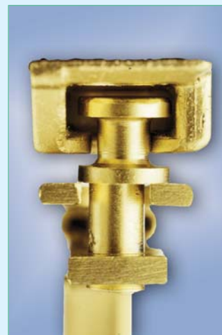
Противовзломная i.S. цапфа MACO