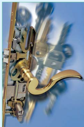
Дверной замок MACO PROTECT