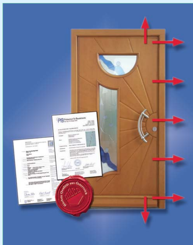
Многозапорные замки MACO PROTECT имеют до 7 точек запираения