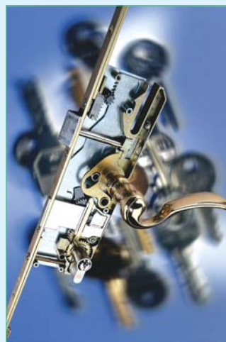
Дверной замок MACO PROTECT